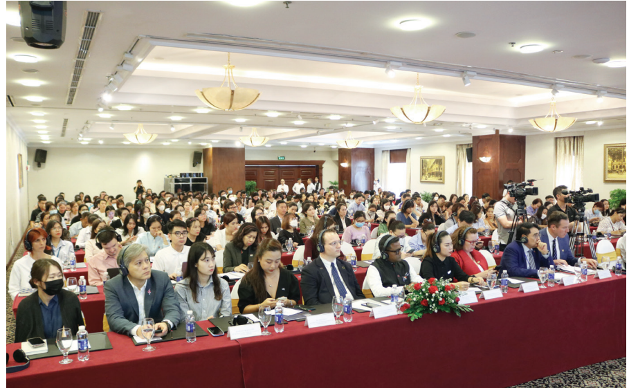
ITPC là đơn vị trực thuộc UBND TP.HCM đã có nhiều hoạt động tạo điều kiện cho doanh nghiệp nước ngoài đầu tư kinh doanh tại TP.HCM và Việt Nam. Trong ảnh là buổi đối thoại giữa Chính quyền TP.HCM với các doanh nghiệp có vốn đầu tư nước ngoài về “Giấy phép lao động và thủ tục xuất nhập cảnh cho người lao động nước ngoài” do ITPC phối hợp tổ chức tháng 4/2023.

Cụ thể, xây dựng nền dân chủ xã hội chủ nghĩa, xây dựng nhà nước