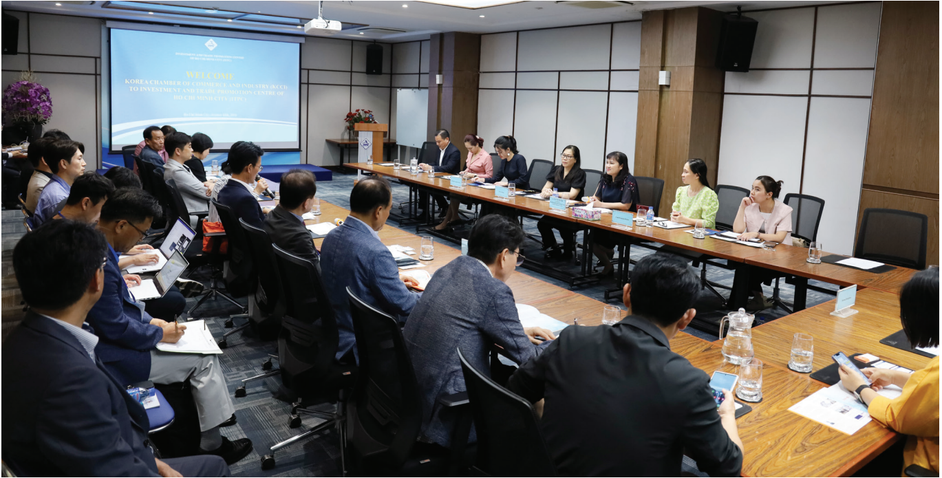
Toàn cảnh buổi tiếp đoàn KCCI tại Showroom 92 - 96 Nguyễn Huệ, Quận 1, TP.HCM.